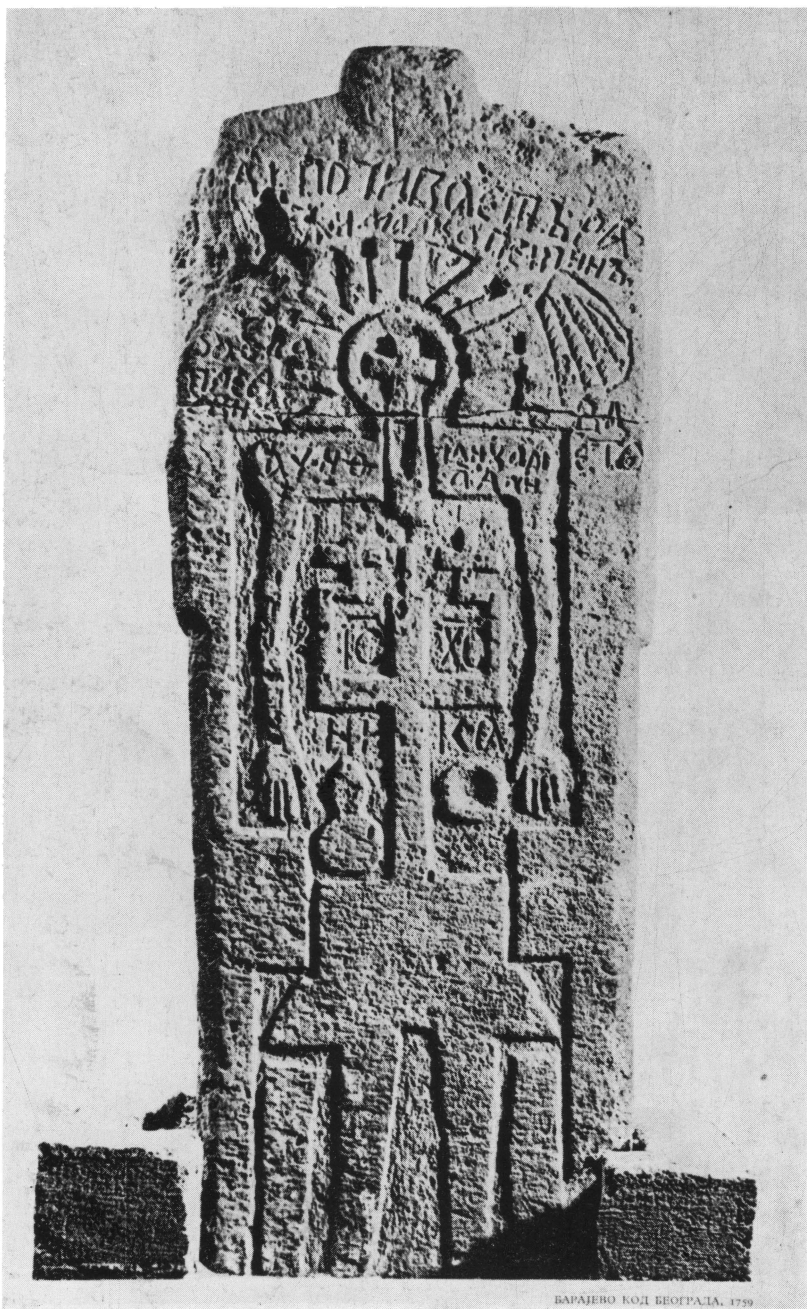
Tab. VI. Etnografski muzej u Beogradu: Nadgrobnii spomenik iz XVIII st. — Pl. VI. Musée ethnographique de Belgrade: Pierre tombale du XVIIIe s.