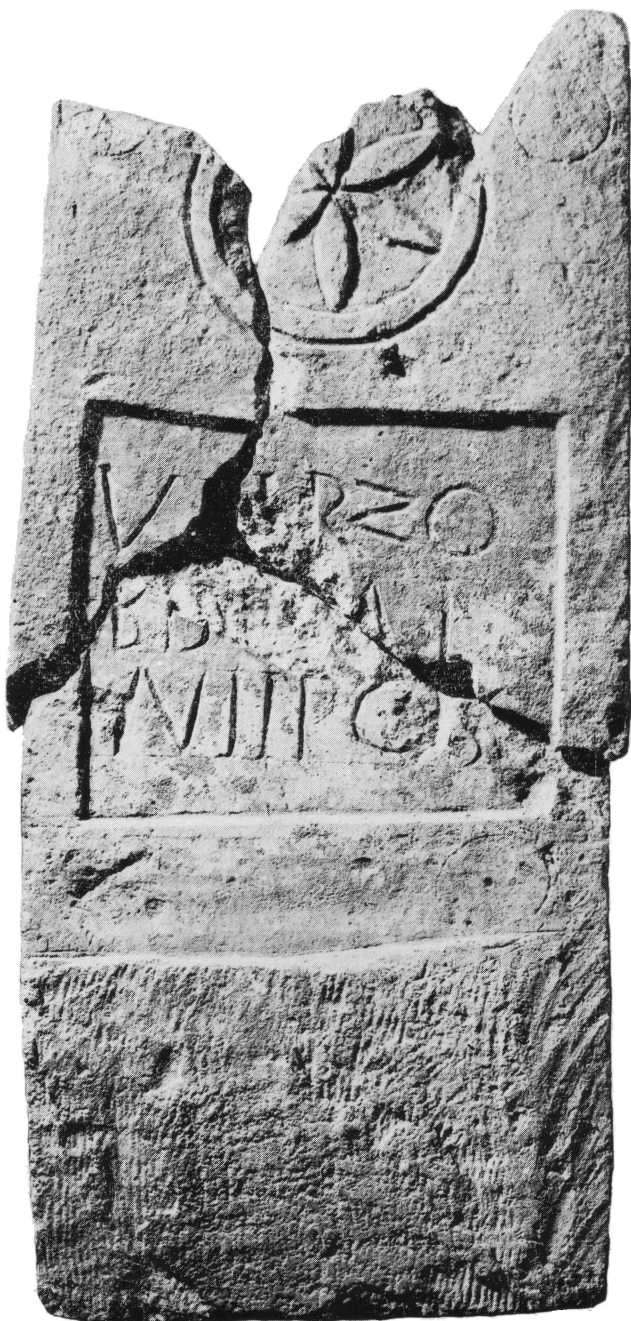
Tab. III. Sinj, Ruduša: Nadgrobni spomenik (C) s natpisom VERZO. — Pl. III. Sinj, Ruduša: Pierre tombale (C) avec inscription VERZO.