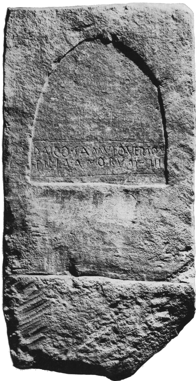
Tab. II. Sinj, Ruduša: Nadgrobní spomenik (B) s natpisom DAICO SAMVIO. — Pl. II. Sinj, Ruduša: Pierre tombale (B) avec inscription DAICO SAMVIO.