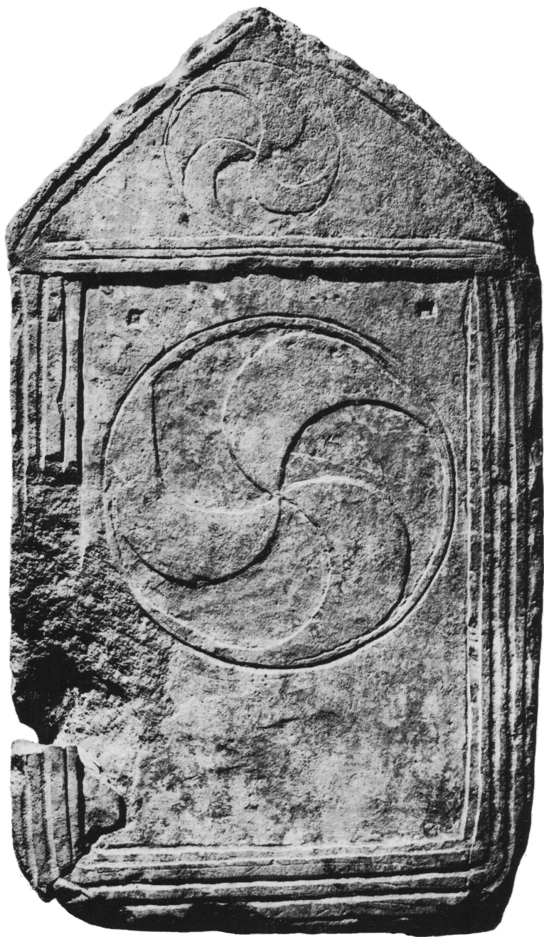
Tab. IV. Sinj, Ruduša: Nadgrobní spomenik (D) bez natpisa. — Pl. IV. Sinj, Ruduša: Pierre tombale (D) anépigraphique.