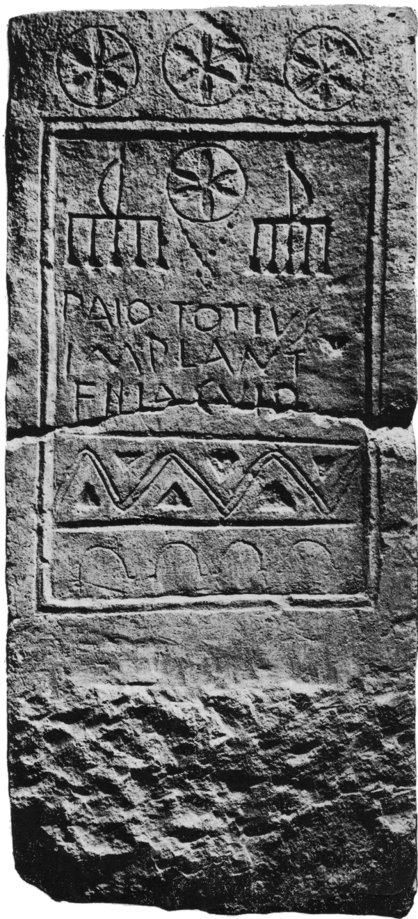
Tab. I. Sinj, Ruduša: Nadgrobní spomenik (A) s natpisom PAIO TOTIVS. — Pl. I. Sinj, Ruduša: Pierre tombale (A) avec inscription PAIO TOTIVS.